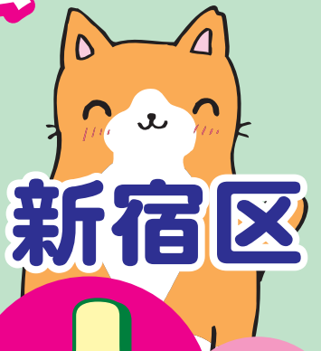
Illustration © Shoko Nakamura & Yuki Nishida